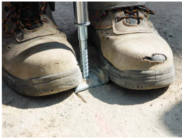
Serraggio della vite