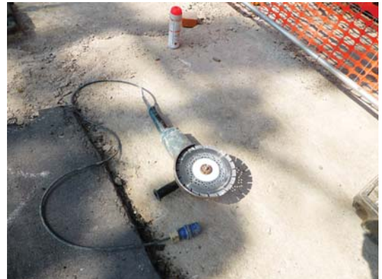
Flessibile con disco diamantato per intaglio