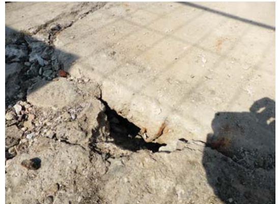
La soletta di copertura esistente

L'intervento realizzato ha previsto la rimozione del materiale esistente sopra la parte strutturale, il posizionamento di una nuova soletta in calcestruzzo armato strutturale alleggerito e il collegamento tra i due strati tramite connettori Tecnar CTCEM. Il carico totale risulta inferiore al carico preesistente, ma la resistenza della struttura aumenta grazie all'incremento di sezione. Conseguentemente risulta aumentata la sicurezza del solaio.