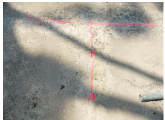
Segnatura delle tracce su cui fissare i connettori ed intaglio del calcestruzzo